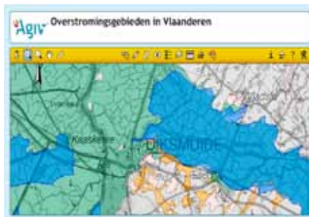
NOG's en ROG's rond Diksmuide

instanties en van verschillende kwaliteit. Ook verschillende gemeenten gaven de contouren van recente overstromingen op hun grondgebied door. Deze kaarten geven eerder een indicatie van de omvang van de overstromingsproblematiek in een bepaald gebied. Door een correctie op basis van het Digitaal Hoogtemodel Vlaanderen (DHM) zijn ze bruikbaar op perceelsniveau. De streek rond Diksmuide bijvoorbeeld was van nature overstroombaar zowel vanuit de zee (groene gebieden