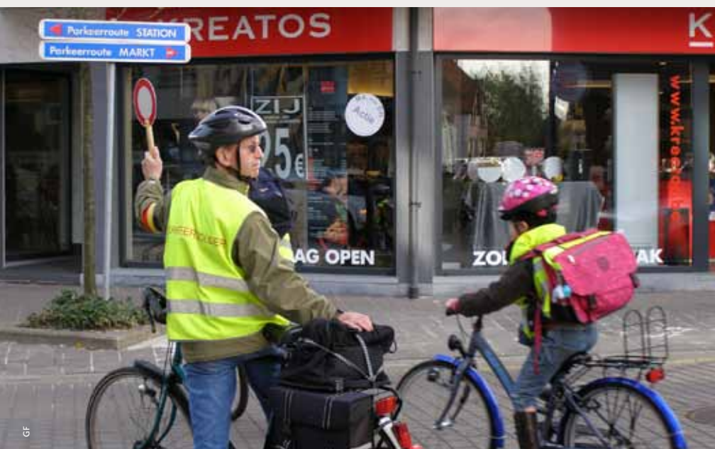
De begeleider krijgt een C3-bordje, een helm en een fluovest met fietspoolopdruk.